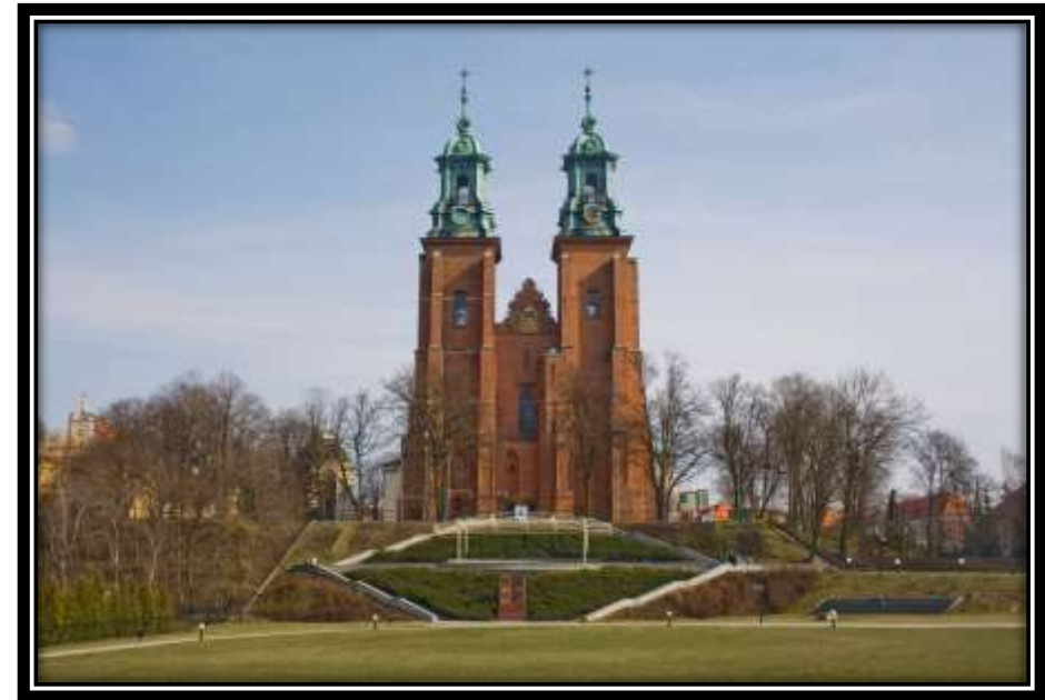
Archidiecezja gnieźnieńska, powołana w 1000r